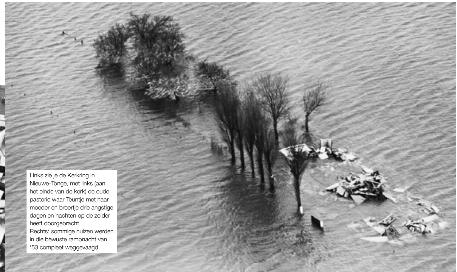
Links zie je de Kerkring in Nieuwe-Tonge, met links (aan het einde van de kerk) de oude pastorie waar Teuntje met haar moeder en broertje drie angstige dagen en nachten op de zolder heeft doorgebracht. Rechts: sommige huizen werden in die bewuste rampnacht van '53 compleet weggevaagd.